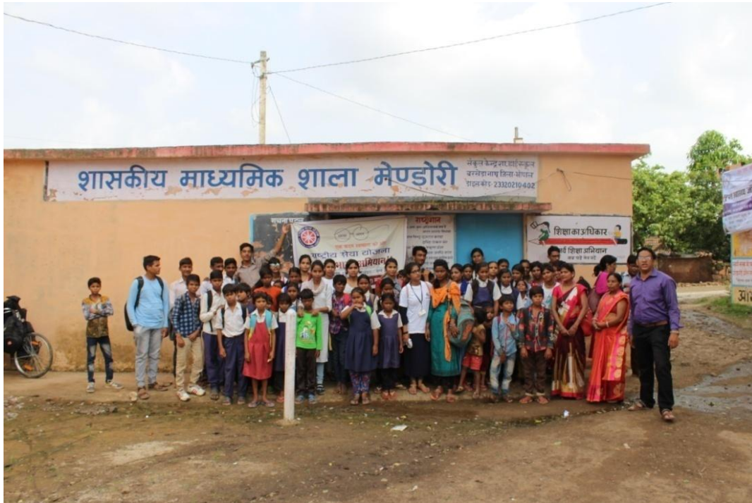
मेण्डोरी ग्राम में स्वच्छता अभियान