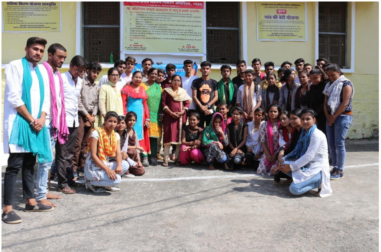
बीज बैंक की स्थापना – 09.01.19