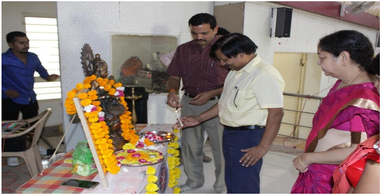
अभिमुखीकरण कार्यक्रम में स्वागत – 06.10.18