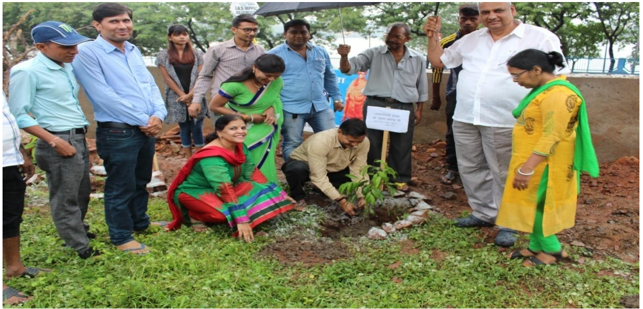
वृक्ष वितरण कार्यक्रम – 24.07.18