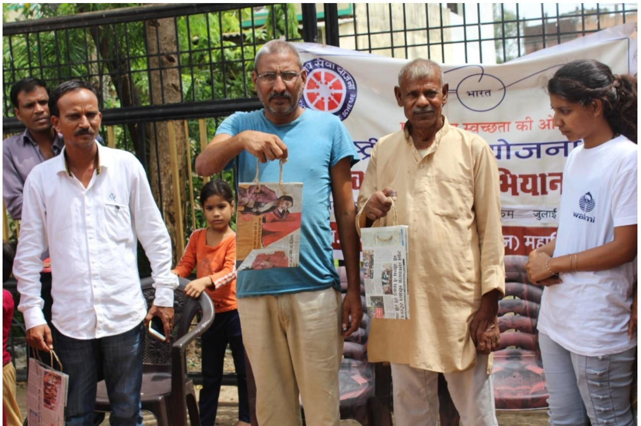
स्वयंसेवकों द्वारा मण्डोरी गांव में स्वच्छता पर जनसंपर्क – 31.07.18